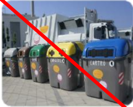
Recollida en superfície