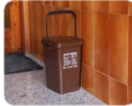
Porta a porta

Lliurament dels residus davant de la porta de casa, en uns dies i hores determinats per a cada fracció.